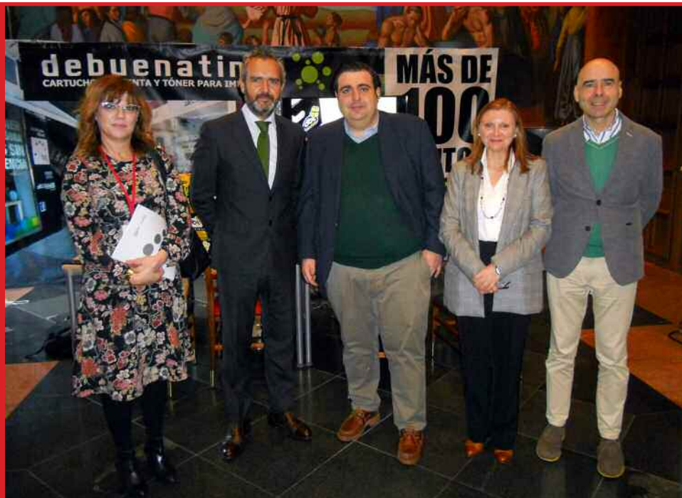
Imagen de la inauguración de AsturFranquicia 2017

AsturFranquicia , Feria de la Franquicia en Asturias, celebrará el día 29 de noviembre de 2018 en Gijón su VII Edición. Este evento es el encuentro profesional de referencia en Asturias entre centrales franquiciadoras, consultoras especializadas en franquicia y emprendedores e inversores interesados en adherirse al Sistema Comercial de Franquicia.