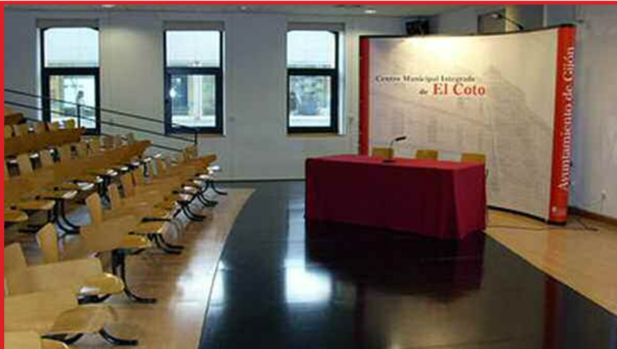
Vista interior de las instalaciones del Centro Municipal Integrado “El Coto”

El objetivo final de las instituciones y asociaciones participantes es dar a conocer/informar directamente a los futuros emprendedores en el sistema comercial de la franquicia de la existencia de los distintos instrumentos de apoyo a la iniciativa empresarial existentes en el Principado de Asturias.