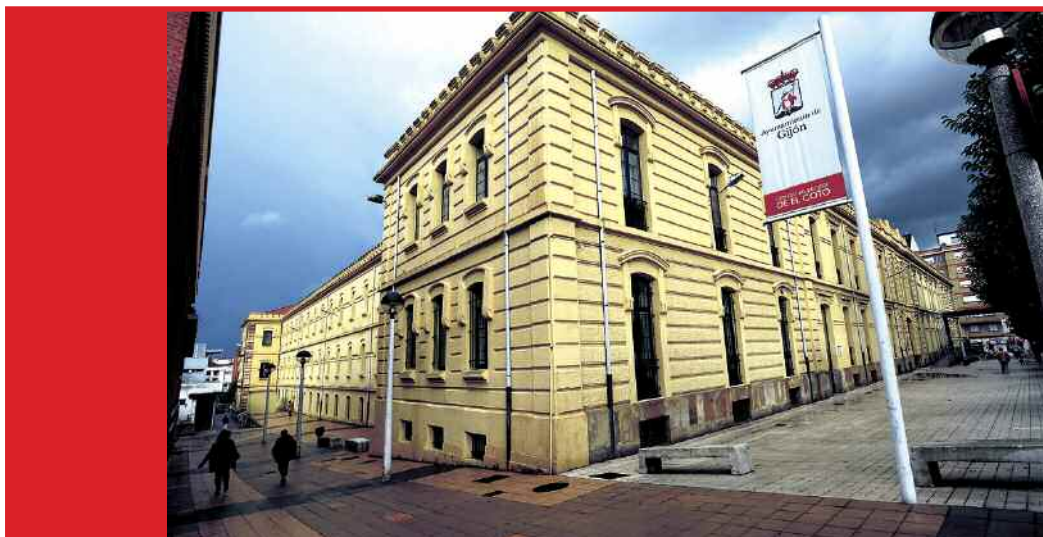
Vista exterior del Centro Municipal Integrado “El Coto”, en Gijón

AsturFranquicia, Feria de la Franquicia en Asturias, organizada por Working Comunicación y con la colaboración activa de AFyEPA, Asociación de Franquicias y Emprendedores del Principado de Asturias, celebrará su VII Edición el jueves 29 de noviembre de 2018 en el Centro Municipal “El Coto” en Gijón.